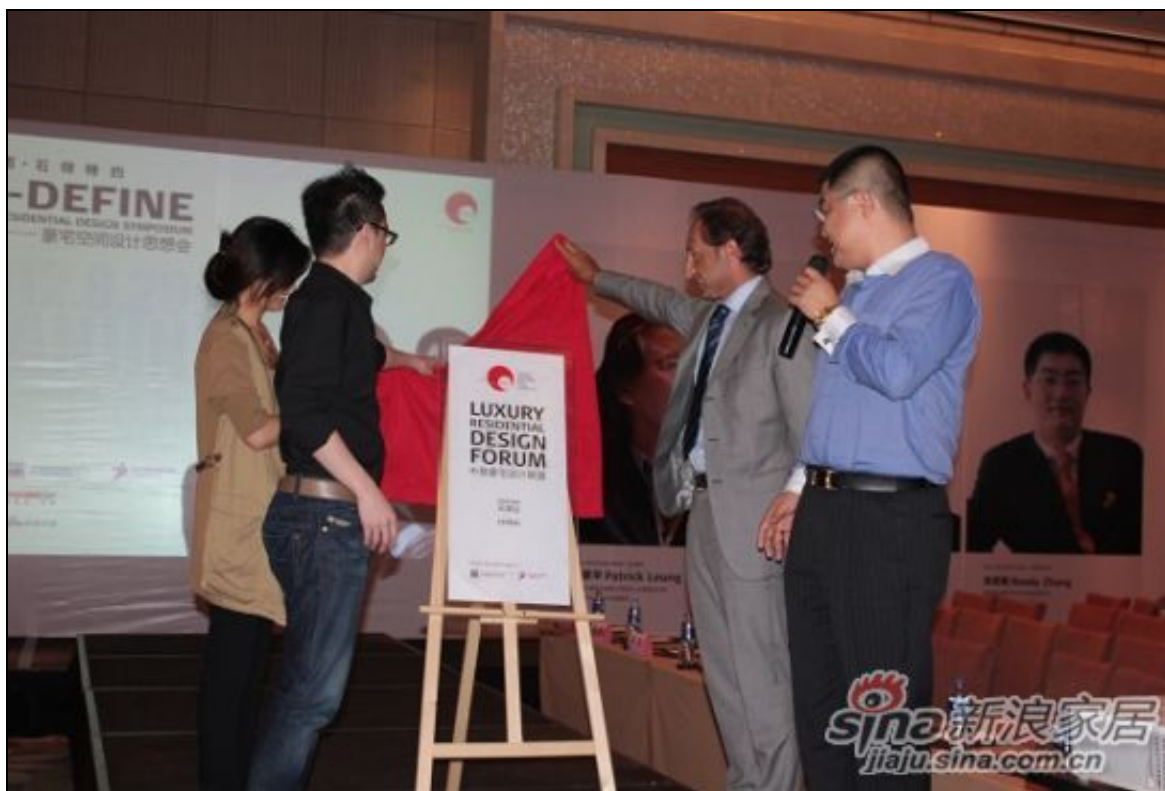
米洛西石砖 再定义豪宅天津思潮涌动

8月28日，广州国际设计周与意大利室内设计师协会携手米洛西石砖特约“再定义-豪宅空间设计思想会”，在天津君隆威斯汀酒店隆重举行。香港十大设计师梁景华、意大利设计师马特奥·彼埃瓦尼、IFI国际战略咨询委员会委员/广州国际设计周执行总监张宏毅等中意两国设计界领军人物与500多名天津设计精英一道，掀起对豪宅设计乃至生活方式再定义和重新思考。