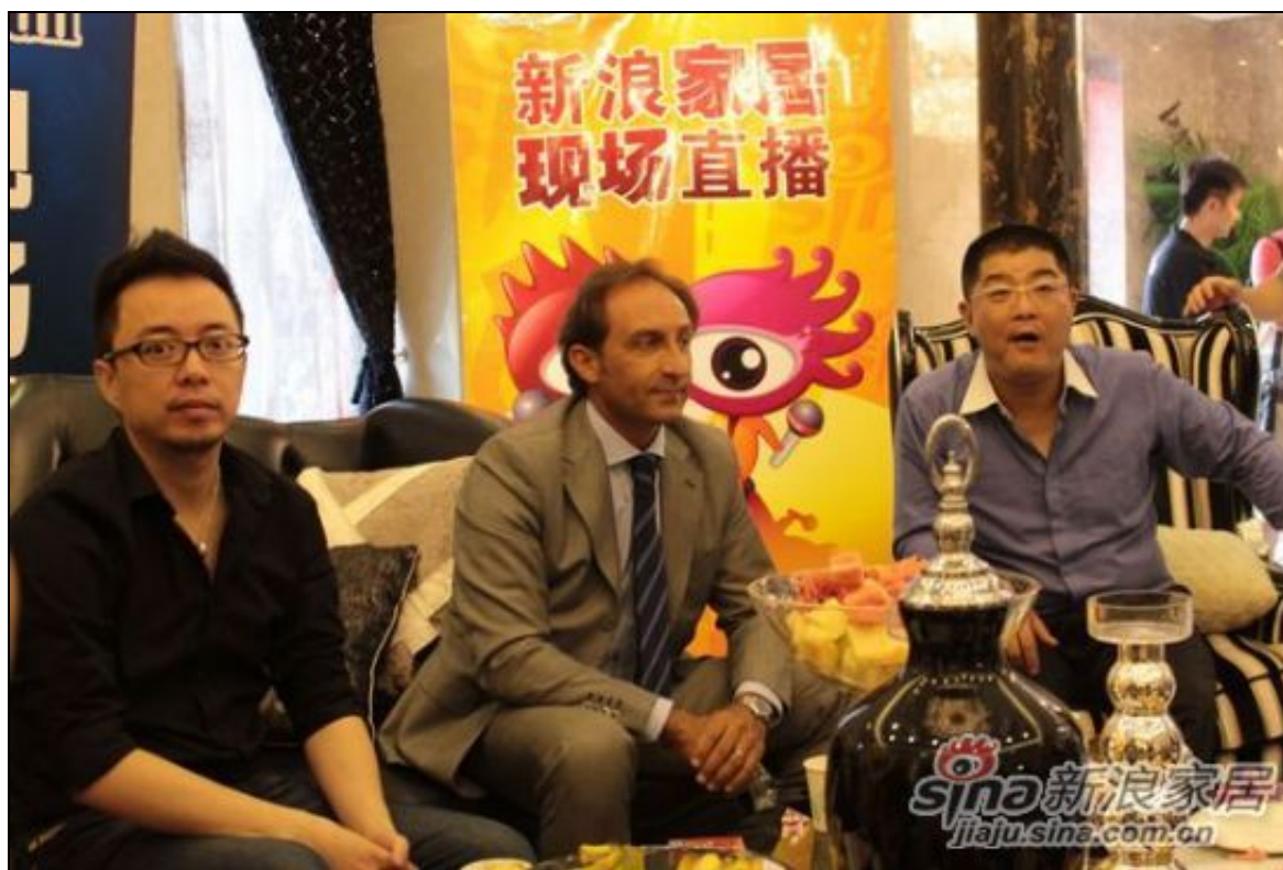
米洛西瓷砖 再定义豪宅天津媒体见面会

所有这一切，的的确确我们非常感动，非常非常赶到庆幸，有米洛西瓷砖这样的品牌，能和我们开始这么一个在定义豪宅的全新的历程，所以在这里面请大家再花一点时间，我们再次零距离接触一下米洛西，请开大屏幕。