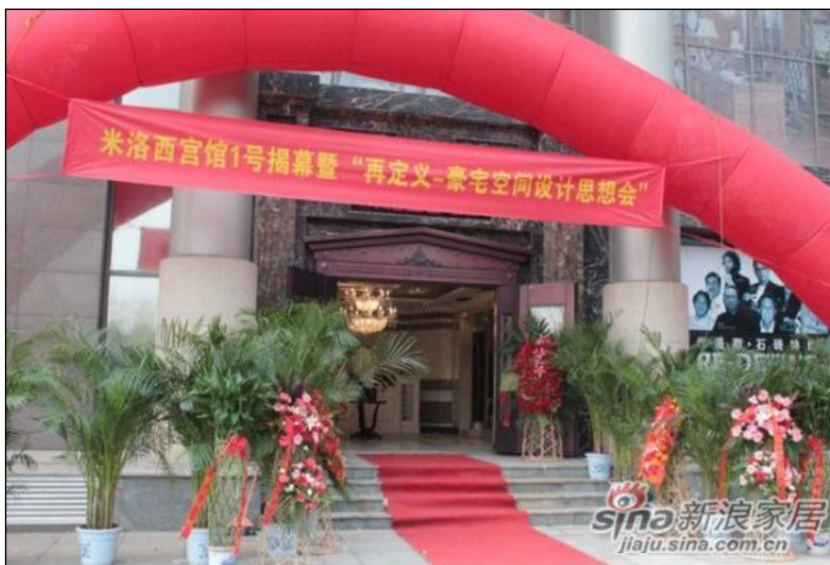
米洛西石砖 再定义豪宅天津思潮涌动