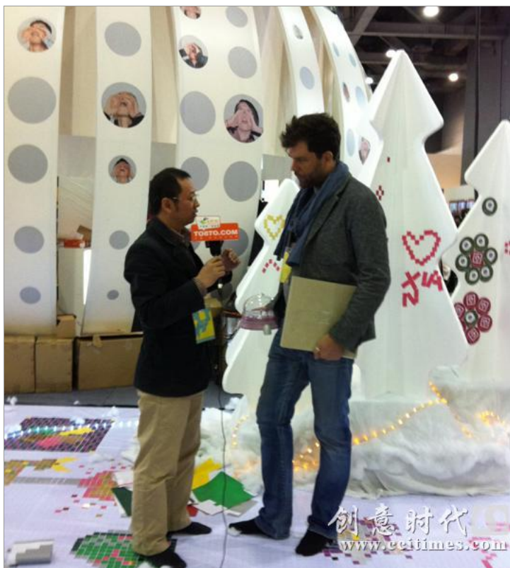
荷兰设计师的中西合璧