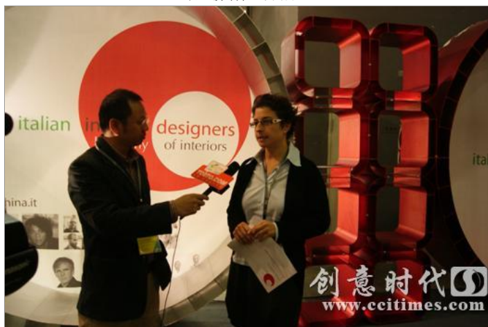
意大利维吉女士向土巴兔坦言对中国市场的看重