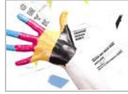
组图：颇受网友欢迎的