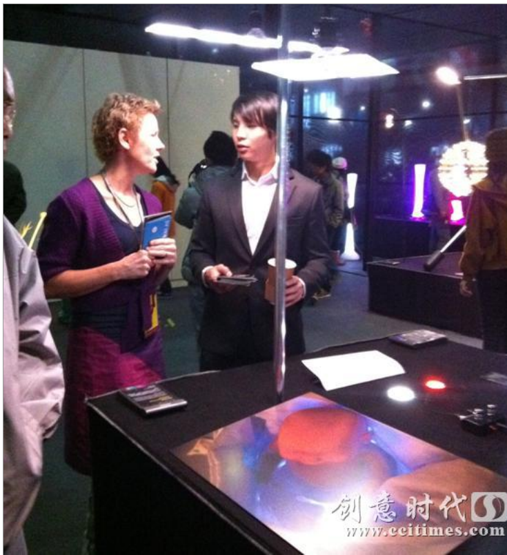
荷兰设计师与香港设计师的竭诚合作

http://www.ccitimes.com 2011-12-19 17:07:27 新北青网