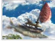
组图：幻想的异度空间