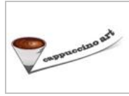
组图：设计师们看过来