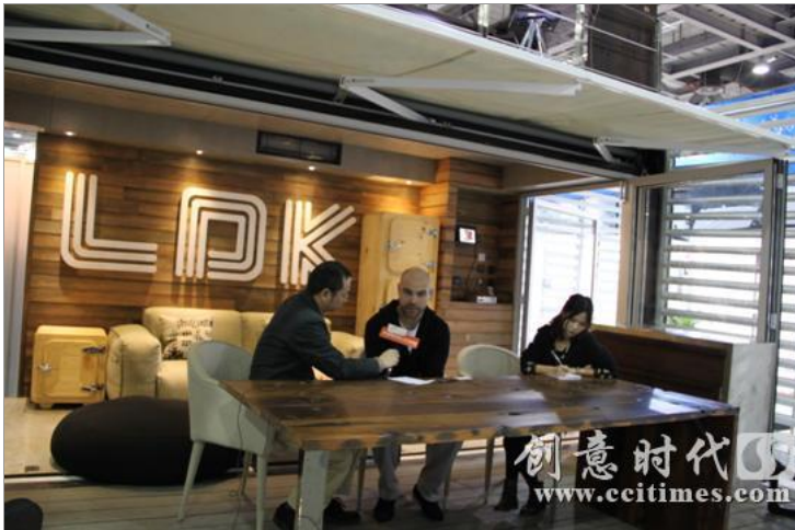
新西兰设计师与土巴兔一起探讨中国与海外设计的异同及个人看法

走进广州国际设计周，众多国外设计师纷纷表示中国设计市场庞大，他们对未来国内的设计市场非常看好，并已经或准备在中国开展设计工作。国外设计师凭借在国外的设计教育和氛围熏陶，加上他们的国际化视野，将给国内设计市场带来变革与冲撞，他们凭借自身的优势，开始抢食国内设计市场蛋糕了。我们不禁惊呼：国内设计界，狼来了！