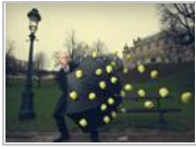
组图：送给爱做梦的你