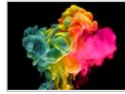
组图：爱充满色彩的世界