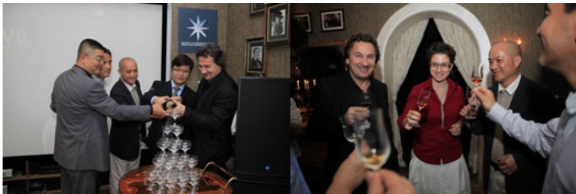
大家举杯预祝盛典成功

公馆内每一处难得一见、工艺精致、艺术独到的欧洲贵族生活藏品，都可以点亮设计师的创作灵感，这也正是此次活动启动酒会选择在沐蕾拉·帝思公馆举办的原因所在。