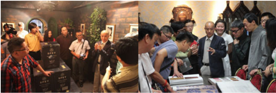
1. 参观英国皇家御用美酒 - 诗贝概念酒窖 2. 设计师们惊叹沐蕾拉·帝思墙纸的高贵与奢华

公馆内每一处难得一见、工艺精致、艺术独到的欧洲贵族生活藏品，都可以点亮设计师的创作灵感，这也正是此次活动启动酒会选择在沐蕾拉·帝思公馆举办的原因所在。